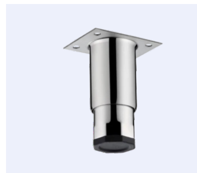
Kit Pés Inox · Inox Feet Kit Cód.129004_3