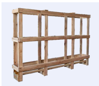
Embalagem Madeira · Wood Package