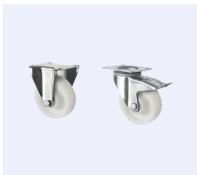
Kit Rodas · Wheels Kit Cód.129001