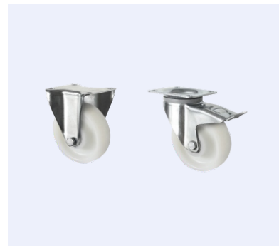
Kit Rodas · Wheels Kit Cód.129001